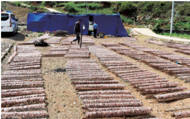
■威宁县一处野生蚯蚓加工点。

记者发现,电捕野生蚯蚓并非个案,在江苏、云南、黑龙江等地均有发生;尤其是江苏省涟水县,电捕蚯蚓现象严重。