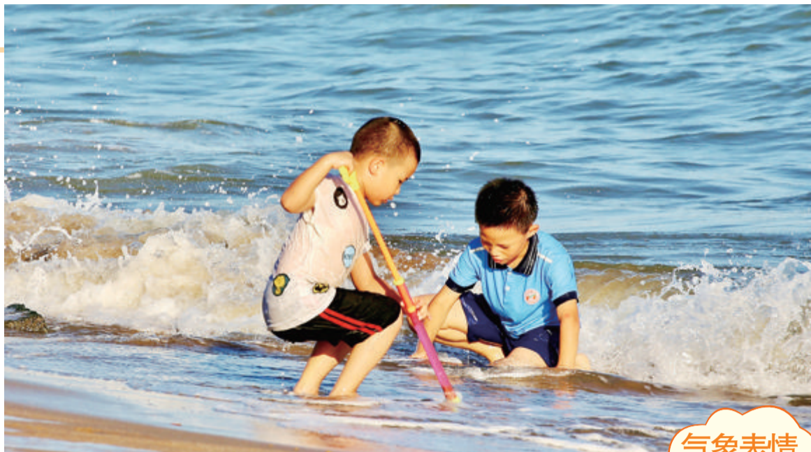
海浪送爽 尾页摄于环岛路曾厝垵