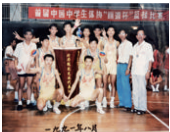
■1991年，同安一中篮球队在首届全国中学生体协“丽源杯”篮球赛中勇夺第二名。