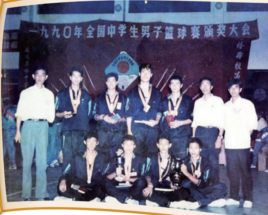
■1990年，同安一中篮球队在全国中学生篮球比赛中获得第三名。