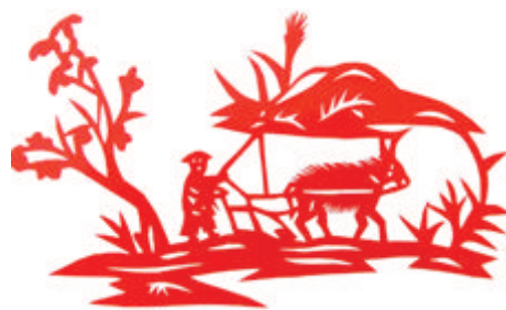
农夫 丁秀华 作