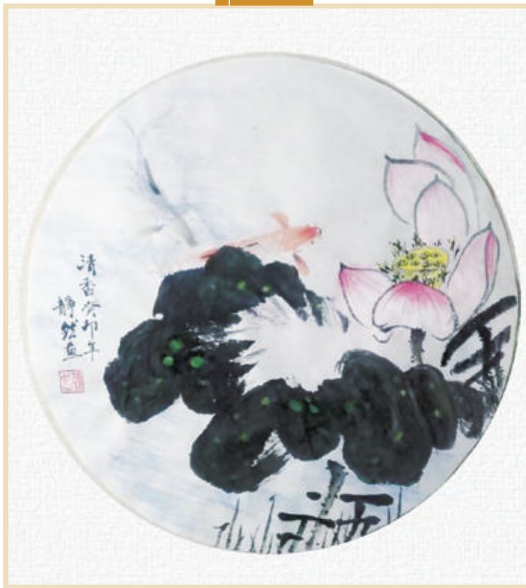
鱼戏莲叶间 静然 画