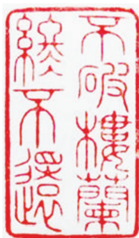
不破楼兰终不还 张旭辉 刻