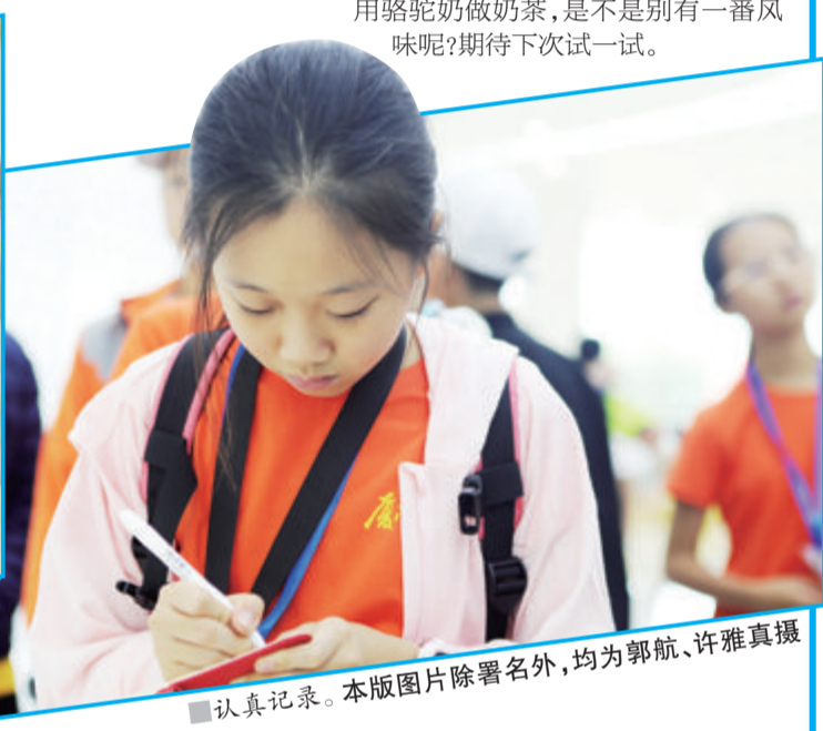
认真记录。