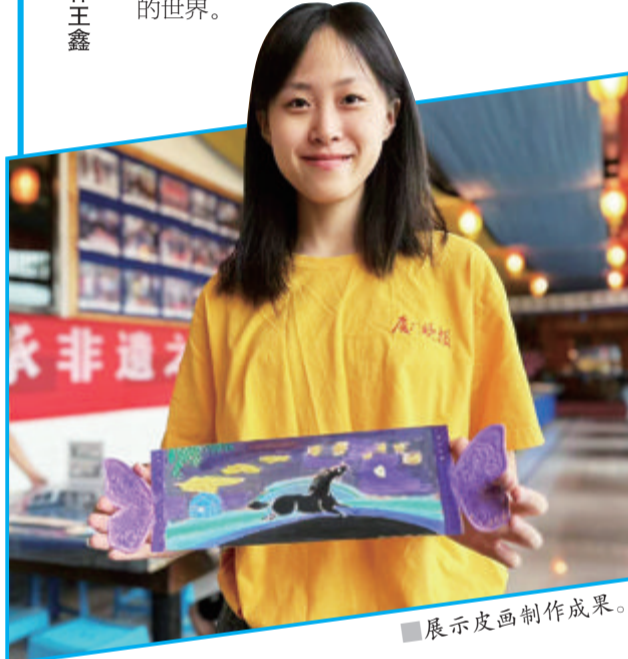
展示皮画制作成果。