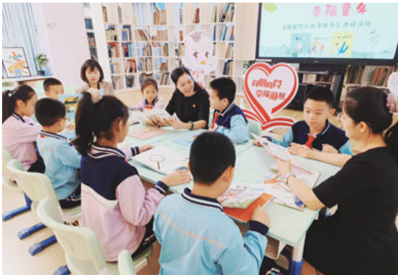
■ 学校营造书香校园，组建了160多个阅读共同体。