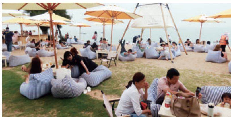
■旅游市场从暑期火到9月。