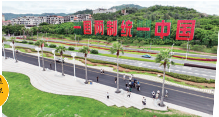
■海浪造型丰富现场景观。