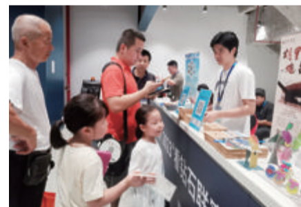
■文旅展区吸引观众打卡。

本报讯(文/记者 刘佳盈)看钻石联赛,游诗意厦门。9月2日晚,流光溢彩的白鹭体育场内,观众热情似火,运动员激情澎湃。场外,设置于白鹭体育场三楼B08的厦门文旅展区,以充满本地旅游特色的产品及“体育+旅游”新玩法,吸引观众到此打卡,沉浸式体验厦门文旅消费新场景。