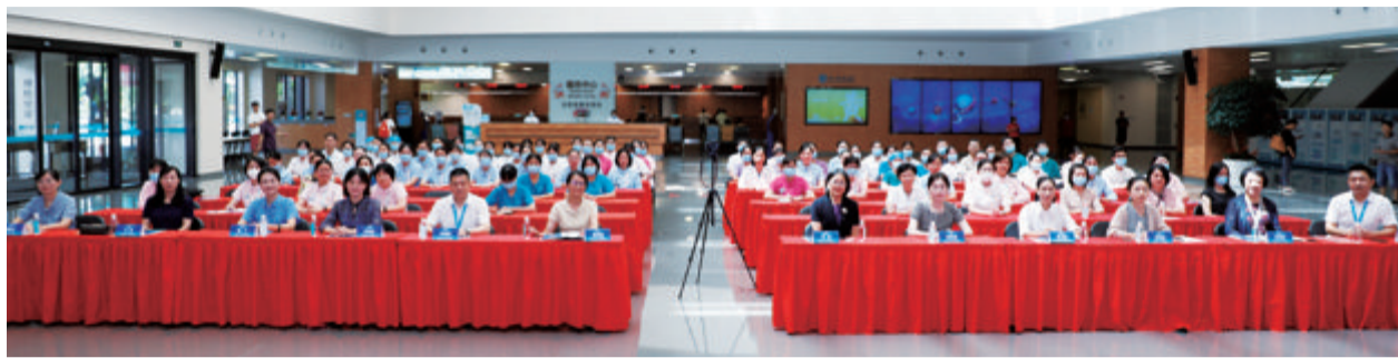
“互联网+居家护理”服务标准化试点工作启动大会现场。