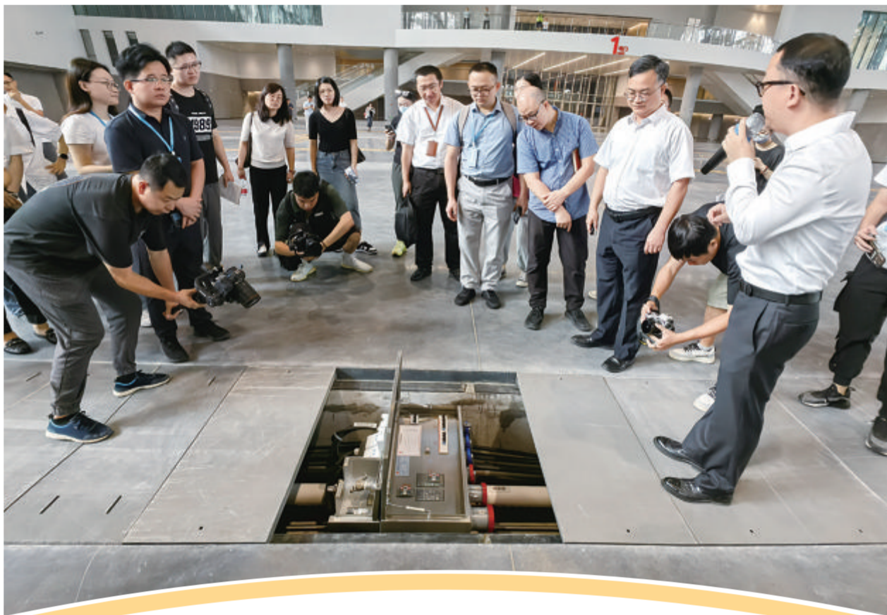
采访团探访厦门国际博览中心。

深化改革开放，推动跨岛发展。今年是改革开放45周年，也是翔安区建区20周年。昨日，由市委宣传部主办的“央媒话厦门·中国改革开放45周年厦门行”集中采访活动在翔安区启动。围绕跨岛发展主题，来自人民日报、新华社、中央广播电视总台、光明日报等20多家中央、境外和省市主要新闻媒体的近40名记者探访厦门国际博览中心、福厦高铁，了解我市重大建设项目进展情况；走进马塘村、大宅社区，品尝农副产品，体验新农村新风貌，感受我市乡村振兴建设取得的成果。 文/图 记者 戴舒静