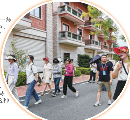
采访团走进「厦门第一村」马塘村。

据悉，仅2022年，火龙果就为大宅创造收入4000多万元。同时，该村还进一步延伸产业链条，打造火龙果衍生品IP，研发出火龙果酒等10余种加工产品；创立“富美大宅”品牌，打造“产业+文旅+居住”的乡村休闲旅游目的地，已建成包含商业配套、精品住宿的民宿小集群，成为厦门新晋网红民宿，吸引大批游客前往观光度假。