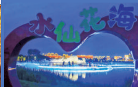
▼夜幕下的水仙花海一角。