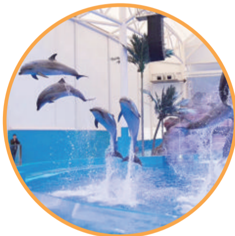
天柱山欢乐大世界海豚剧场

长泰还有许多好玩的、好吃的等您来发现,更多资讯请关注“新长泰微新闻”微信公众号或“慢客长泰”微信小程序。