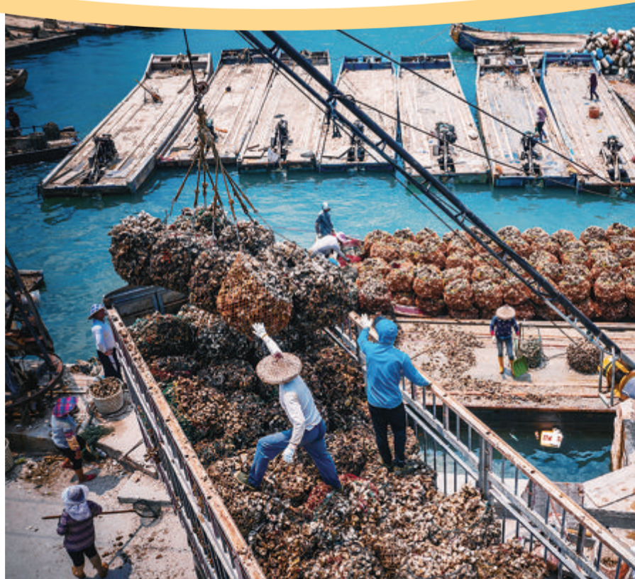
诏安牡蛎一派丰收景象。

诏安县地处闽粤交通要冲,物产丰富,土壤富含硒元素。诏安人善于吸收各地烹饪技艺,辅以各类新鲜食材,加上源源不断的创新发展,极大丰富了“吃在诏安”这张代表性名片。当地特色小吃达30多种,让您回味生活幸福真谛。其中,诏安特色小吃有猫仔粥、荷叶包、麦粿、贼婆面、春卷、虾枣、发粿、无米粿等;特色海鲜有清蒸石斑、海蛎紫菜煲、酱油水杂鱼、清蒸虾蛄、炒花蛤等。