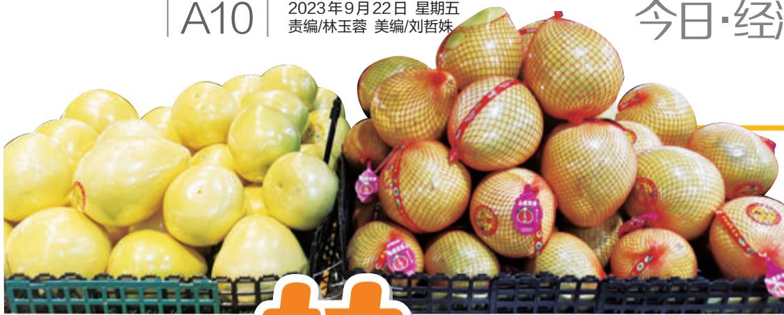
■硕大饱满、黄澄澄的柚子集中陈列。