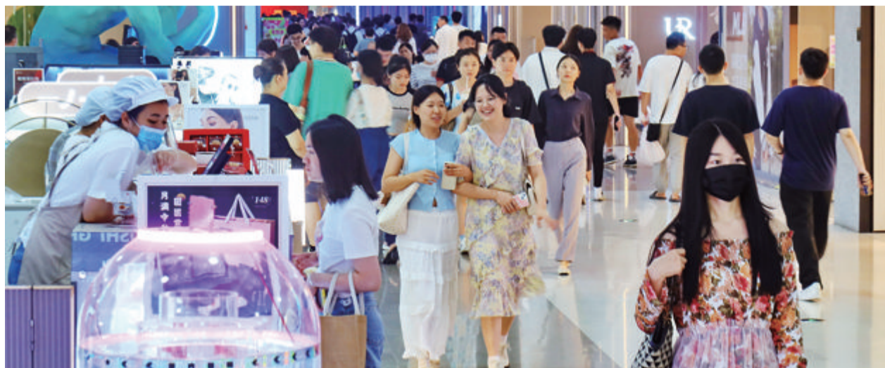
■ 我市各大商圈人气旺盛。