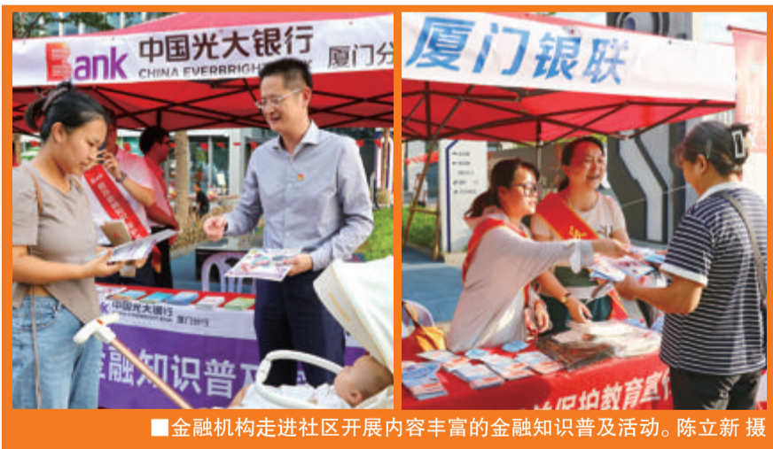
■金融机构走进社区开展内容丰富的金融知识普及活动。

“这样的进社区宣传特别好,既帮助我们增强金融安全意识,又倡导理性消费观念,很有意义。”居民孙女士说。“新厦门人”赵先生则表示,通过本次厦门银联的宣传,他知道了做好隐私保护的重要性,以后一定要注意保管好个人信息,为自己的账户安全上一道“锁”。 (记者 郭舒晨)