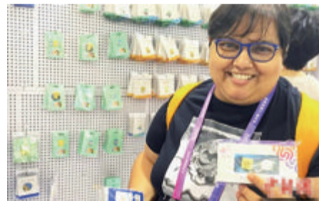
■印度的女记者展示她喜爱的亚运徽章。