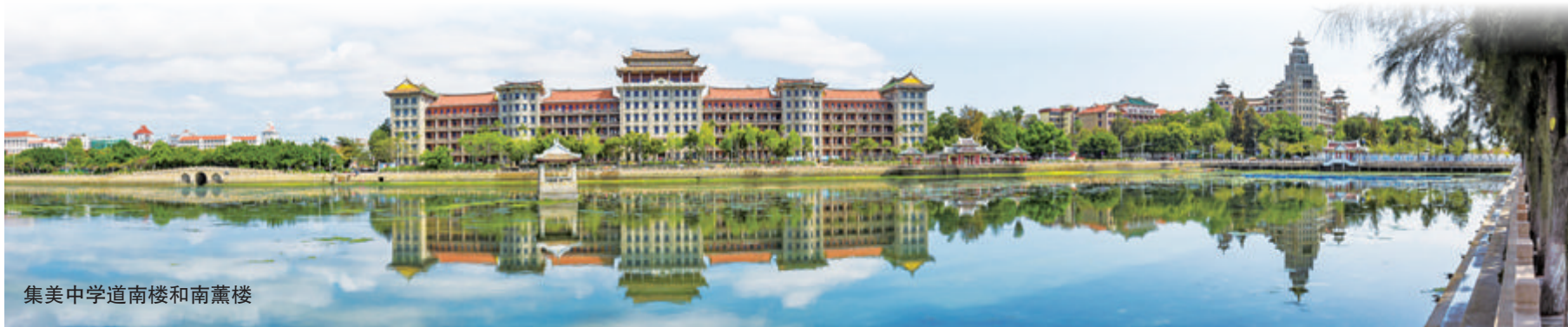
集美中学道南楼和南薰楼

立国之例”,引申划定“集美为中国永久和平村”,“无论何派军队不得屯驻村内或侵扰之。有战争时任何方面均不得以集美为交战地。如有违犯者,各军共击之”。划定集美为永久和平学村的倡议及请愿,获得当时军政当局、大学、新闻界及社会名流的支持,集美学村由此名留青史。