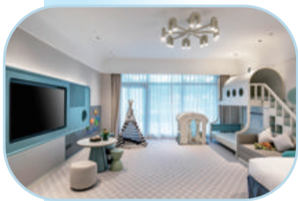
超大豪华主题亲子房