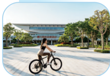
酒店为客人免费提供专业自行车