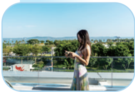
客房露台休闲放松