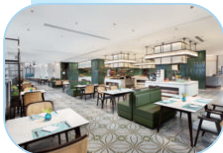
怡海苑海鲜大牌档

有别于市面上传统的大排档餐厅,怡海苑海鲜大牌档依托建发国宾馆强大的供应链,从源头上对食材进行严控和甄选,只选当日南海海捕冰鲜海货,选用无菌可生食的鸡蛋,肉禽均来自天然牧场,以及高山有机蔬菜,现杀、现煮、现烹,由2017年金砖国家领导人厦门会晤欢迎晚宴厨师团队亲自操刀把关,烹制健康美味的系列菜肴。从仅28元/份的“闽南砂锅饭”、68元/例的“生态大黄鱼面线”到“帝王蟹”或“稻田生态甲鱼九吃”,无论是工作日的简单午餐,还是请客吃饭讲排面,都能在这个轻南洋风餐厅找到心仪的菜谱。餐厅也供应价格厚道的原产地大米、实惠装可生食无菌蛋等,给每位前来用餐的食客奉上方便的食材。