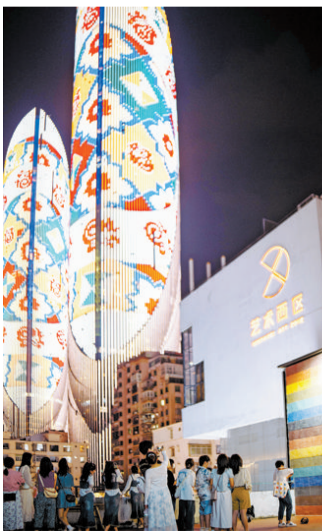
沙坡尾艺术西区成为年轻人热门打卡地。