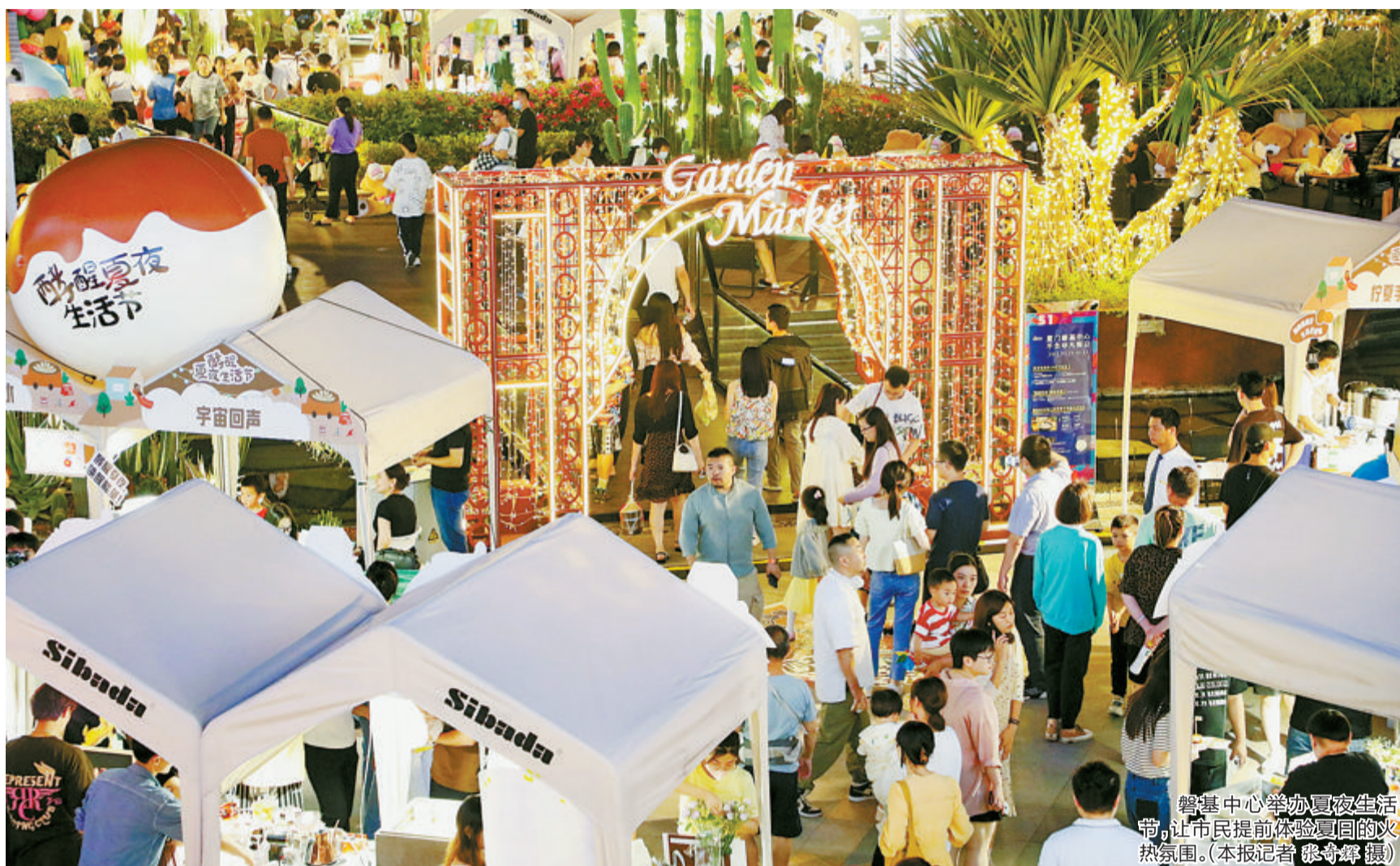
鹭基中心举办夏夜生活节，让市民提前体验夏日的火热氛围。