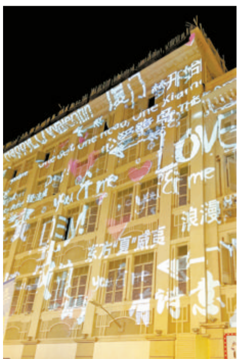
▶昨日，中山路五一灯光秀浪漫上演。