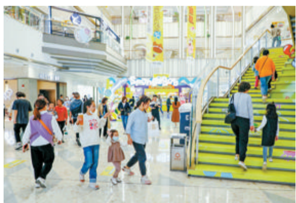
▲集美世茂广场人气红火，主题活动吸引眼球。