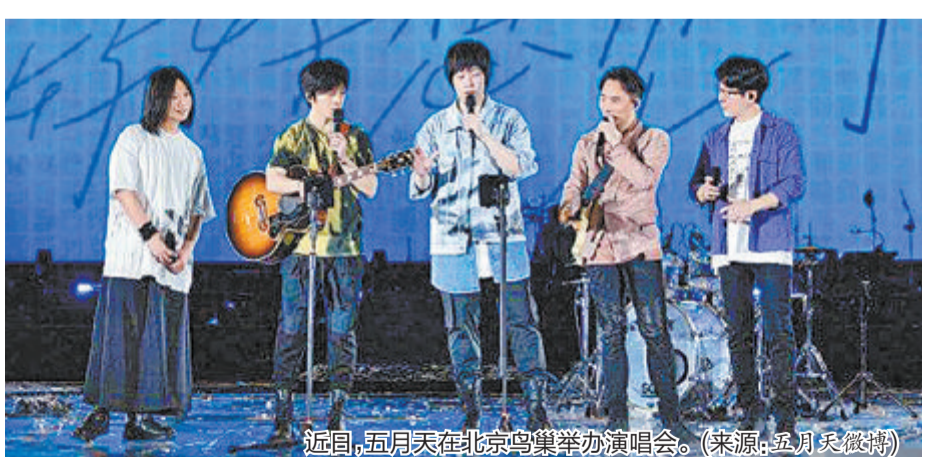
近日,五月天在北京鸟巢举办演唱会。

4月底,张信哲启动“未来式2.0世界巡回演唱会”,任贤齐启动大陆巡回演唱会。5月起,张韶涵也在大陆举办巡演。刘若英2023“飞行日巡回演唱会”将在6月和7月赴南京、北京、苏州开唱。蔡依林、林宥嘉、周杰伦、张惠妹等台湾歌手也将启动大陆巡演。 此外,《乘风破浪的姐姐第四季》《声生不息·宝岛季》等音乐真人实境秀节目,近期一播出也在海峡两岸暨港澳地区引起热议,多位台湾艺人参与其中,周兴哲、A-Lin、魏如萱、陈嘉桦等人在节目中皆有亮眼表现。