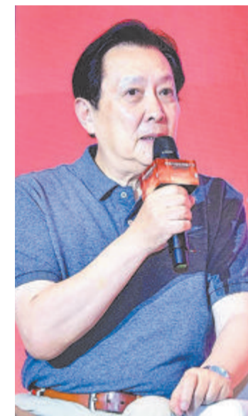
唐国强在论坛上发言。